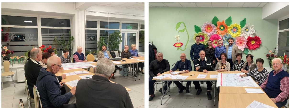
Fot. 4. Uczestnicy debaty z przedstawicielami organizacji społecznych

Uczestnicy odnieśli się również do przedsięwzięcia związane z organizacją ruchu kołowego w obrębie obszaru rewitalizacji. Zwracano uwagę, które z przejść dla pieszych stanowią największe zagrożenie. Podnoszono, że znajdują się one w obrębie drogi wojewódzkiej, a taka droga posiada inne parametry niż droga o charakterze lokalnym. Wspólnie z uczestnikami dyskutowano również, że po ewentualnej budowie obwodnicy Drezdenka w ciągu dróg wojewódzkich, obecna droga wojewódzka zmieni swój status.