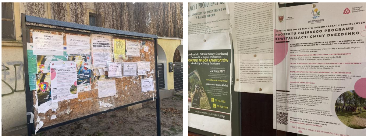
Fot. 2. Plakat z zaproszeniem do udziału w konsultacjach społecznych

Zaproszenia do udziału w konsultacjach społecznych opublikowano ponadto dwukrotnie w mediach społecznościowych Urzędu Miejskiego w Dreźnie na początku oraz na końcu trwającego okresu konsultacji. Ponadto w okresie trwania konsultacji opublikowano artykuł w lokalnej gazecie samorządowej wydawanej pod tytułem „Gazeta Dreźnieńska” dotyczący podlegającego konsultacjom projektu Gminnego Programu Rewitalizacji Gminy Dreźnie na lata 2022-2030 zawierający podsumowanie spotkania z interesariuszami oraz debaty z przedstawicielami organizacji społecznych, w ramach którego zaproszono mieszkańców do składania uwag.