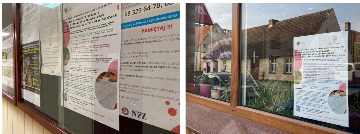
Fot. 2. Plakat z zaproszeniem do udziału w konsultacjach społecznych

Zaproszenie do udziału w konsultacjach społecznych opublikowano ponadto w dniu 13 lutego 2023 roku w mediach społecznościowych Urzędu Miejskiego w Drezdenku wraz z zaproszeniem na spotkanie oraz debatę odbywające się w dniu 16 oraz 17 lutego 2023 roku.