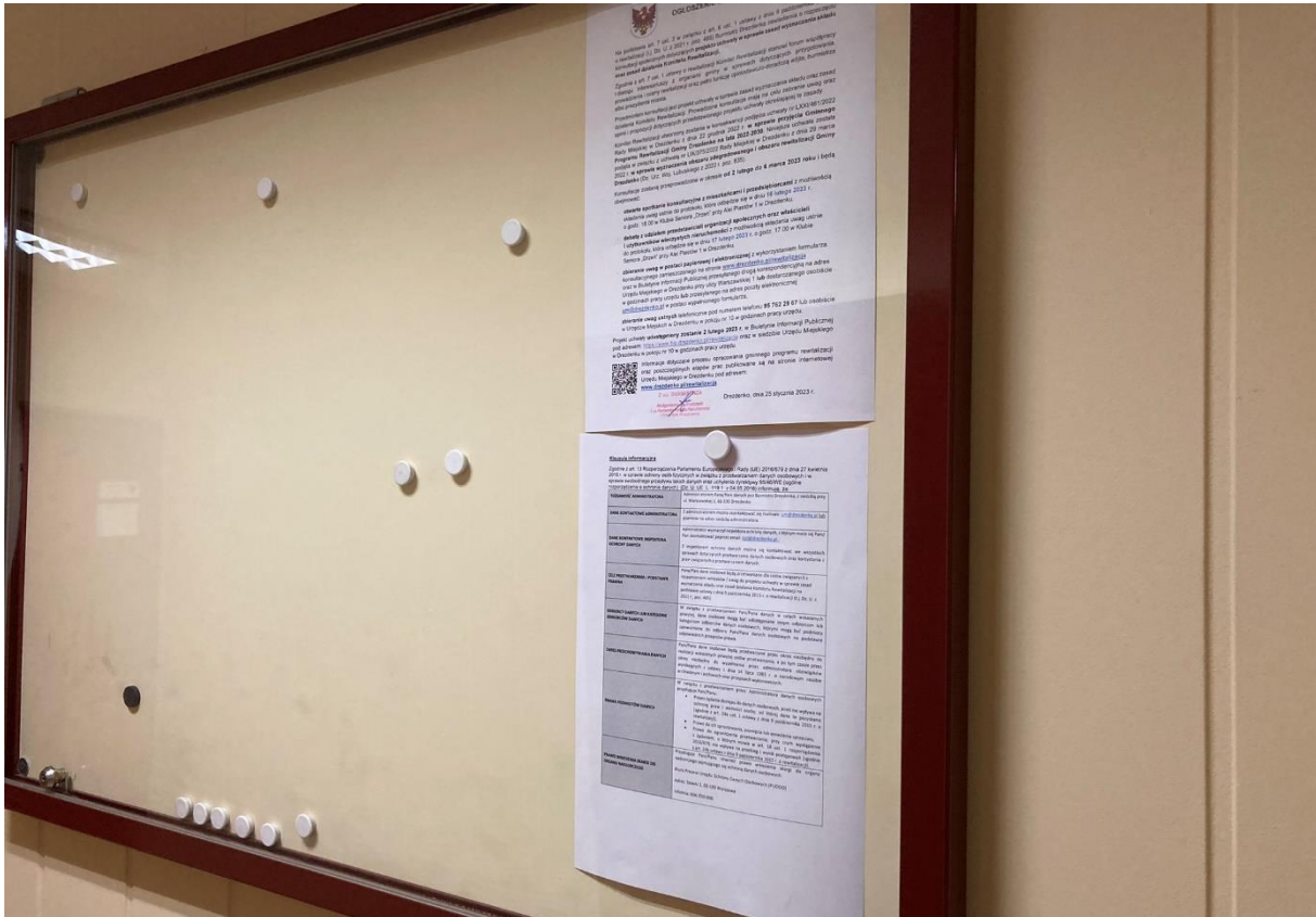
Fot. 1. Ogłoszenie o konsultacjach na tablicy ogłoszeń w siedzibie Urzędu Miejskiego