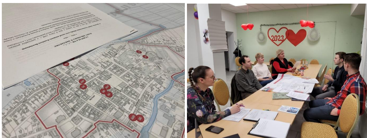
Fot. 3. Materiały oraz uczestnicy spotkania w dniu 16 lutego 2023 roku

Przedstawiciele Konsorcjum Projekty Miejskie , pełniący rolę prowadzących i moderatorów spotkania, przybliżyli uczestnikom rolę Komitetu Rewitalizacji, którego utworzenie wynika z art. 7 ustawy z dnia 9 października 2015 roku o rewitalizacji. Zgodnie z przyjętym założeniem Komitet pełnić będzie funkcję opiniodawczo-doradczą Burmistrza, dlatego w projekcie uchwały wyraźnie podkreślono, że przedstawiciele tego organu nie powinni dominować w strukturze Komitetu Rewitalizacji, który ma charakter gremium społecznego.